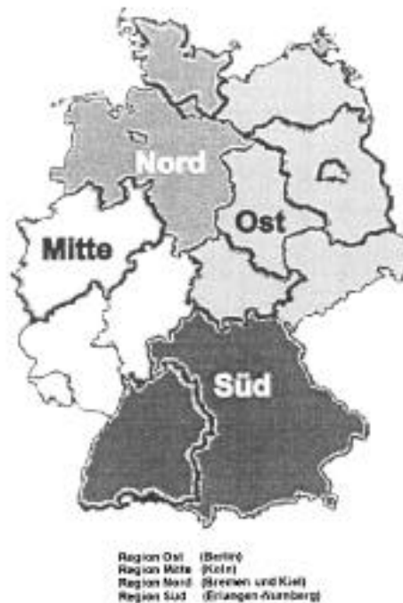
Figura 5 Regiones

La garantía de calidad en la práctica de la psicología jurídica es un tema, que desde hace tiempo se ha tratado de forma intensa (Steller, 1988). La Federación de Asociaciones de Psicólogos alemanes ha dado las directrices para dictaminar, en las cuales están formulados los estándares mínimos. En jornadas psicologico-jurídicas, ha sido debatido en parte este tema en coloquios (Steller, Baumgärtel, Kluck, Offe & Wegener, 1998). Actos de perfeccionamiento y equipos de especialistas son los fundamentos para la garantía de calidad, en el ámbito de la práctica psicologico-jurídica.