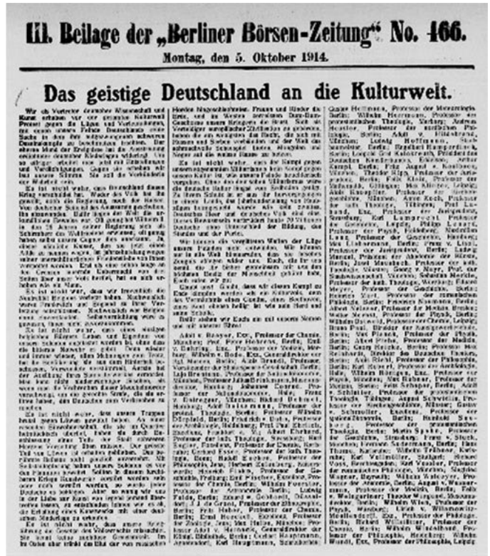
Fuente: Berliner Börsen-Zeitung, 5 Octubre 1914; Hannoverscher Kurier, 6 Octubre 1914.

defensa del Imperio Alemán y, por otra parte, intentaban argumentar que ni el Kaiser o los alemanes querían provocar una guerra en su lugar buscaron todos los medios para evitarla pero Francia e Inglaterra la forzaron a hacerla. Según Wundt, la Primera Guerra Mundial fue planeada desde comienzos del siglo XX con los acuerdos Entente Cordiale de 1904 los cuales fueron ratificados en 1912 entre el rey británico Eduardo VII y el recién electo presidente francés Raymond Poincaré para combatir definitivamente al Imperio Alemán y su intento por consolidarse en una potencia transatlántica,