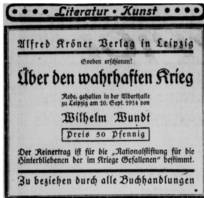
Figura 2. Publicidad de la publicación impresa de la Conferencia de Wilhelm Wundt