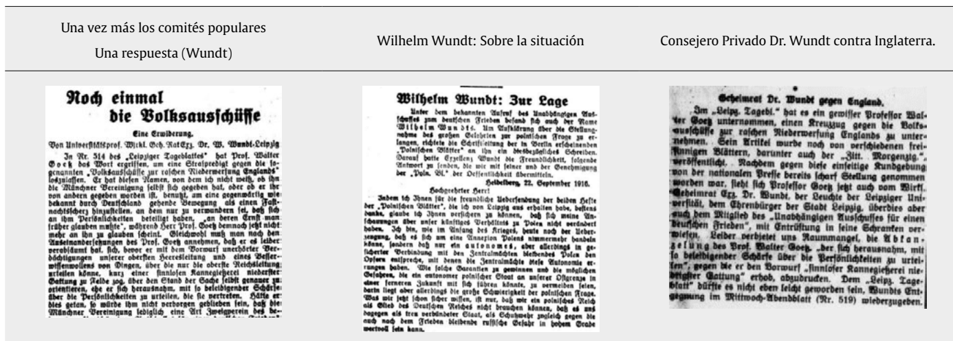
Figura 5. Manifestaciones de Wundt en prensa