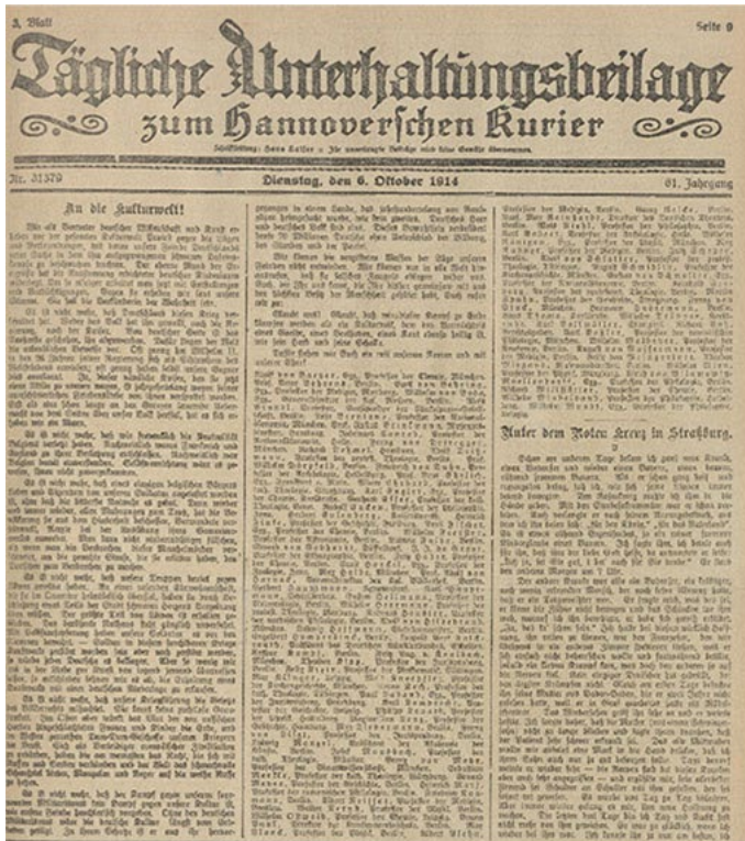
Figura 3. La Guerra Mundial y la Kulturwelt