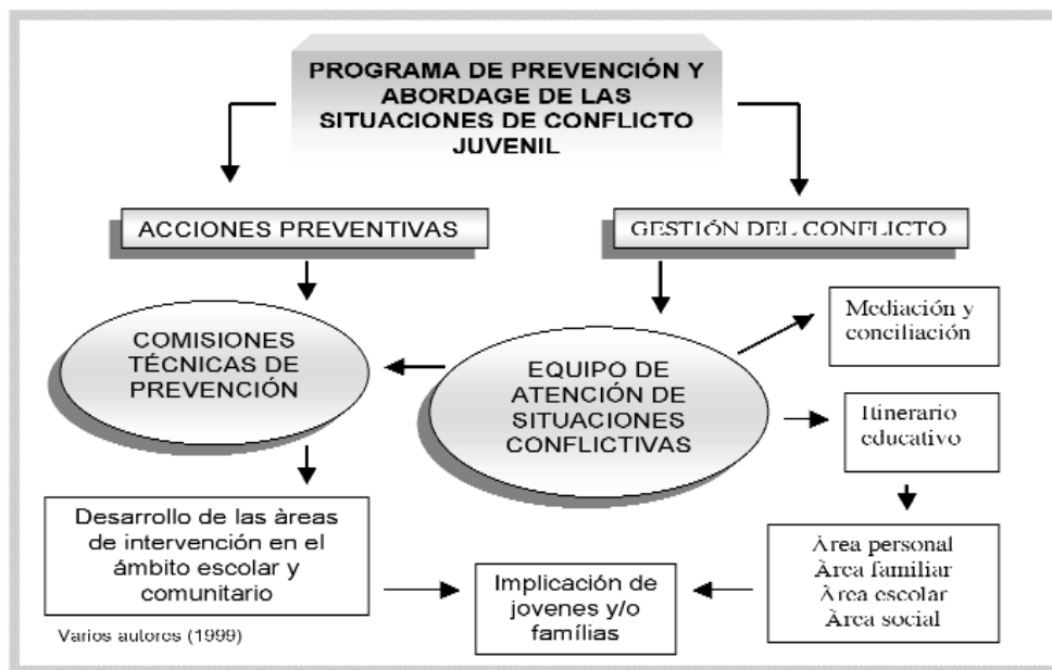
Gráfico 1. Esquema Programa de Prevención y Abordaje de las Situaciones de conflicto Juvenil

numerosos retos para la intervención, y especialmente para la intervención preventiva. En este contexto, el enfoque comunitario de la intervención, posibilita la responsabilidad compartida de las instituciones, permite la participación interinstitucional y la generación, creación y puesta en marcha de alternativas. Además, favorece las acciones sumativas y coordinadas de las instituciones, que confluyen en un determinado territorio y también la de aquellas que tienen responsabilidad sobre el problema y/o sobre el individuo o grupo en cuestión.